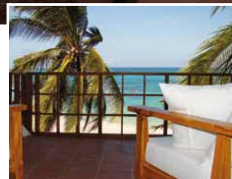
In alto a destra: camera con vista mare e dettagli della zona notte e della terrazza. Sopra: veranda della camera posta al piano terra.